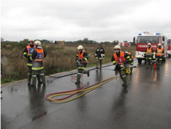
Leistungsprüfung Technische Hilfeleistung