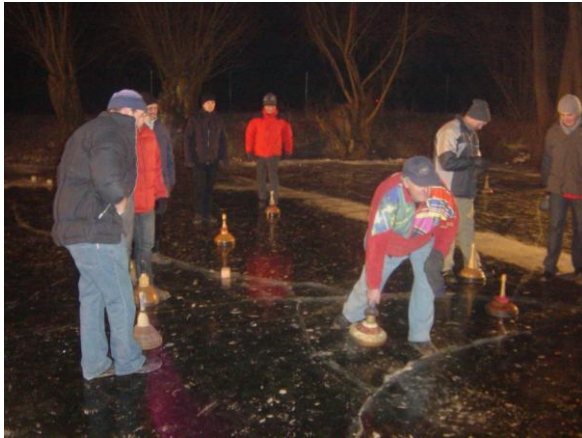
Eisstockschießen am Pfarrerteich