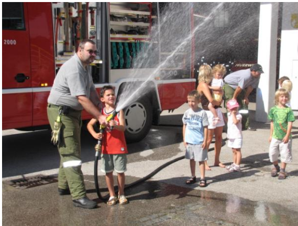
Kindergartenkinder bei der Feuerwehr