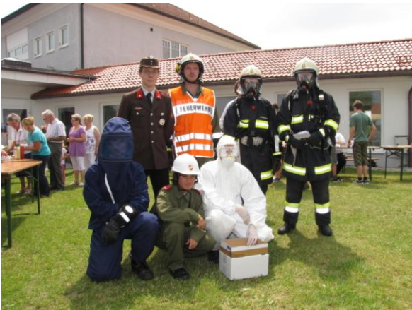
Präsentation HOG Frühschoppen