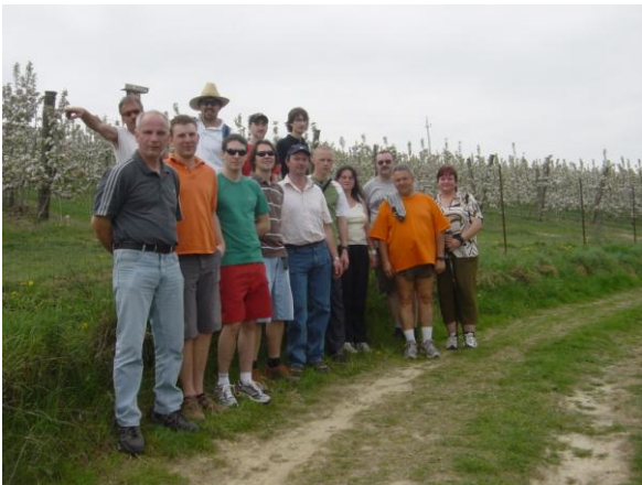
Teilnahme an der Kirschblütenwanderung